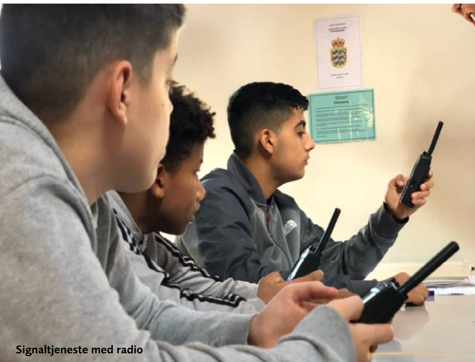
Signaltjeneste med radio

Frederiksberg Kommunes SSP-afdeling og Københavns Politi