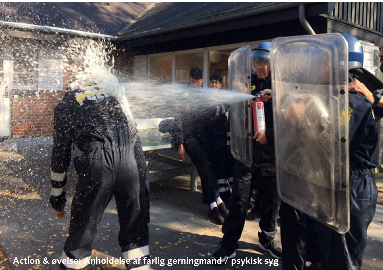
Action & øvelse: Anholdelse af farlig gerningsmand / psykisk syg