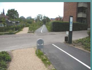
Krydsning uden afmærkning