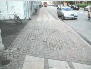
Afbrudt gangbane, brosten