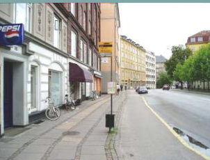
Stoppested uden faciliteter