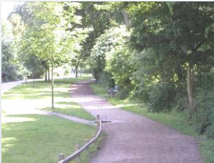
Den Grønne Sti