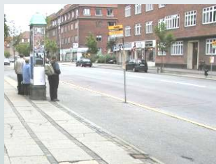
Peter Bangs Vej