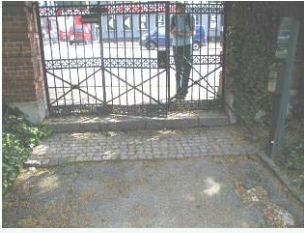
Adg. til Solbjerg Kirkegård