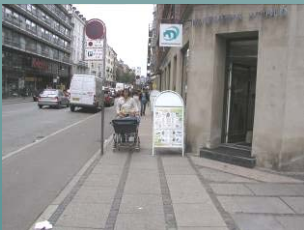
Falkoner Allé; udstilling

De 14 ruter i tilgængelighedsnettet gennemgås i det følgende. Der beskrives hvilke rejsemål der er på de enkelte ruter samt hvordan ruterne hænger sammen med det øvrige tilgængelighedsnet.