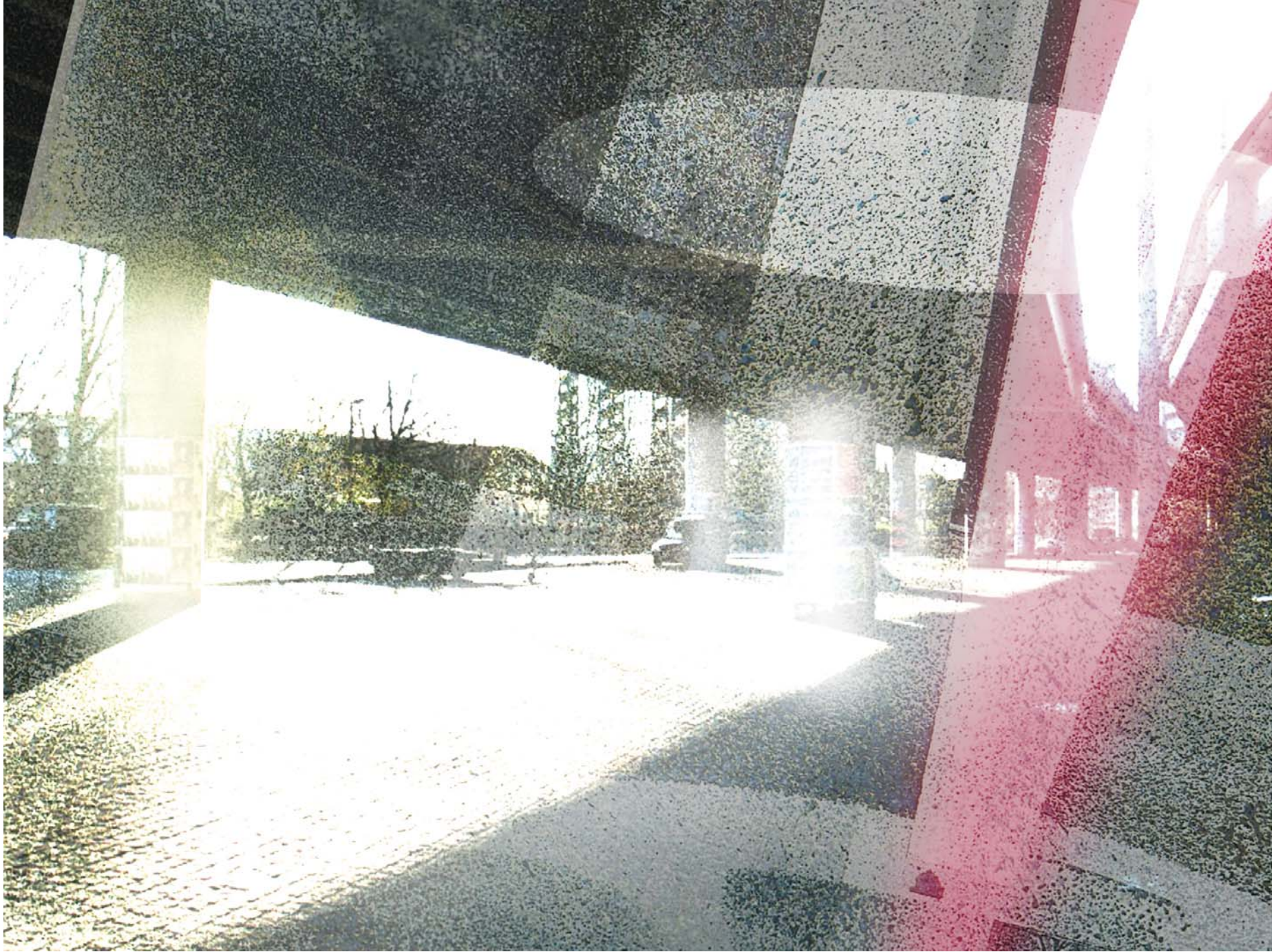
The image shows a modern architectural structure with a large, curved, textured concrete overhang. The foreground is a paved area with a grid pattern. The background shows a building with a red facade and a car parked on a street. The image is overlaid with a semi-transparent red geometric shape on the right side.