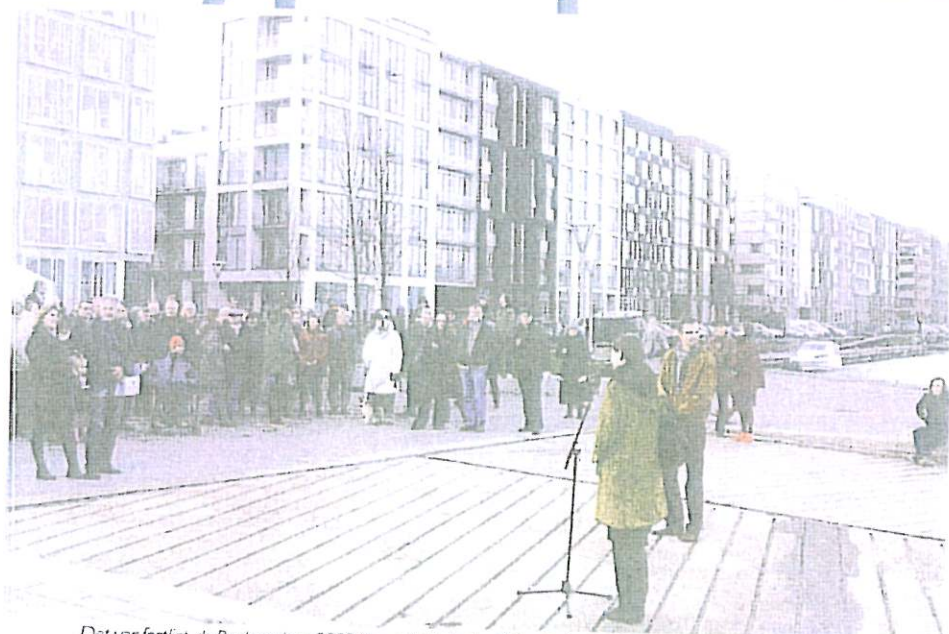
Det var festligt, da Byplanprisen 2009 blev sat på plads på Sluseholmen i København.

Byplanprisen uddeles hvert år for planlægning, der er udtryk for nytænkning og som samtidig dyrker og videreudvikler landskabets og byens egenart og identitet.