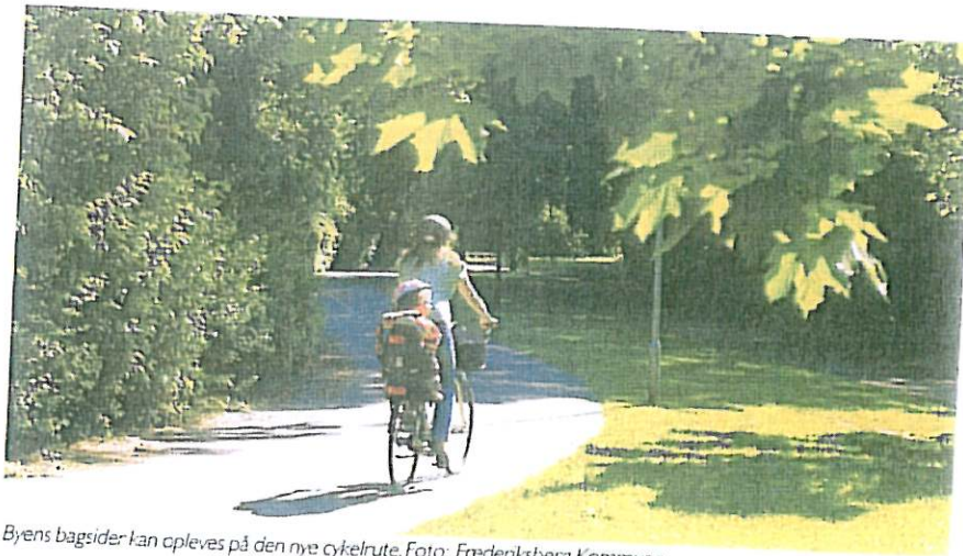
Byens bagsider kan opleves på den nye cykelrute.

"Den Grønne Sti" eller "Norrebroruten" er blevet til i et samarbejde mellem Frederiksberg og Københavns kommuner med henblik på at få flere til at cykle.