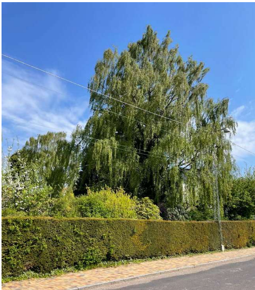
Teglklinkebelægning på fortov, grønne forhaver med levende hegn i form af klippet hæk og værdifulde privatejede træer ved Laurids Bings Allé.

Der er udpeget 461 bevaringsværdige offentlige- såvel som privatejede træer i lokalplanen på korbilag 5, der også fremgår af listen bilag 1.