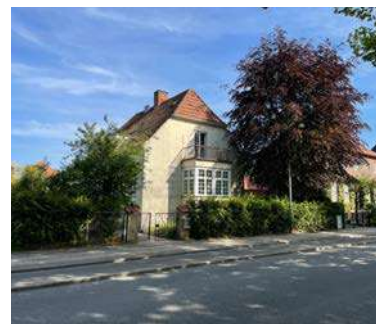
Grønne forhaver med levende hegn og værdifuldt privatejet træ ved Dalgas Boulevard.

Derudover fremgår det, at værdifulde privatejede træer eller beplantningsstrukturer skal sikres bevaret i lokalplaner.