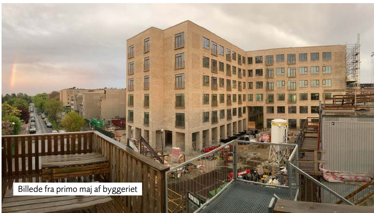
Billede fra primo maj af byggeriet

Indvendigt skrider arbejderne også fremad, og plejeboliger og fællesarealer er begyndt at tage form, nu hvor både gulve og vægge er ved at være færdige.