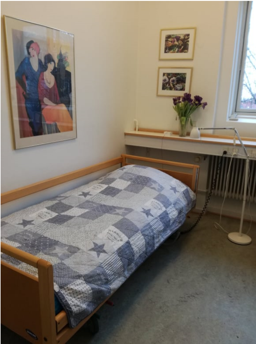
Værelset set fra gangen, med udsigt til træer og tage mod Godthåbsvej